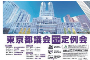
都議会開会告知ポスター

新年度予算を中心に知事提出議案116件など審査。漢人は、一般会計予算、東京2020大会レガシー基金関係など知事提出のうち17件に反対しました。