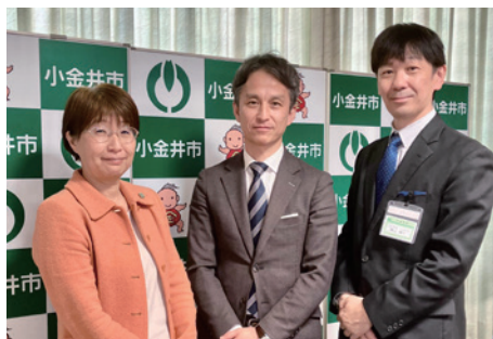
4/11 @小金井市役所 白井亨市長、神山伸一副市長と面談