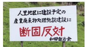
2022年5月の現地視察で撮影

4/10、事業者が操業に必須の冷却水確保が困難と判断し、施設の設置許可申請を取り下げ。村民をはじめとしたみなさんの取組みが貴重な檜原村の自然を守りました。