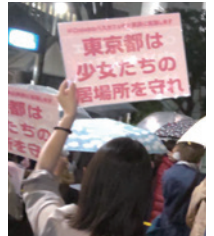
3/29都庁前での抗議行動

都の委託を受けて「若年被害女性等支援事業」に取り組んできた一般社団法人Colaboの活動が不当な妨害に晒され、歌舞伎町でのバスカフェが中止に追い込まれ、都は急遽、委託から補助へと制度変更するなど、事業の停滞が余儀なくされています。