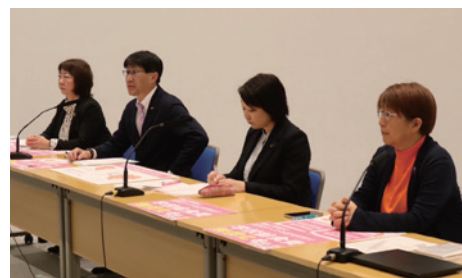
12/8@都庁記者クラブ 給食条例の記者会見

立川市・国分寺市で高濃度汚染が検出された地下水は、今後、小金井に流れてきます。実態把握のための地下水調査強化と血液検査の実施、また汚染拡大を防ぐための米軍横田基地への立入り検査と保管PFASの速やかな撤去の要請は必須です。