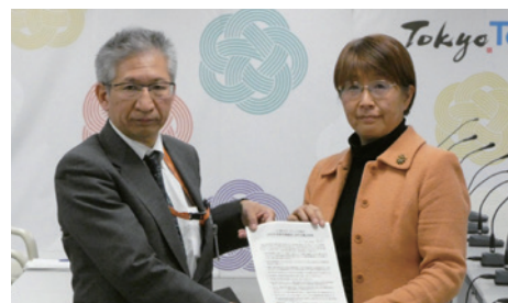
12/21 @都庁ホール 中村副知事に重点政策を手交

12/21 都議会各会派が2024年度予算にむけて予算要望を行いました。グリーンな東京は、要望に限らず「重点政策の提言」をしています。中村副知事(大会派は知事)に手交・説明し、副知事から「年明けの知事査定で判断し、1月下旬に予算案発表。第1回定例会で議論を」とのコメントがありました。