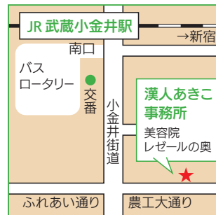
武蔵小金井駅南口3分