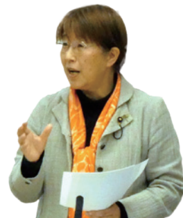
12/15 環境・建設委員会で質問

小金井市は雨水浸透ますの設置率も世界一で、「グリーンインフラ」(自然が持つさまざまな機能を活かした取り組み)の先進地です。