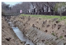
3/23@玉川上水 桜以外の樹木が 皆伐された