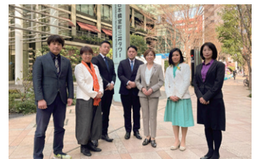
3/7@日本橋三井タワー 超党派の神宮外苑議連で樹木保存の要望書提出

能登半島地震を受け耐震・災害対策強化が求められます。従来型の国土強靱化や、環境破壊の小金井2路線や神宮外苑再開発など道路・超高層ビル優先の都市整備・開発事業を検証し、自然の力を活かしたグリーンインフラ拡大などで、気候と生物多様性の2大危機を乗り越え、災害にも強い、しなやかなまちづくりへの大転換が急がれます。