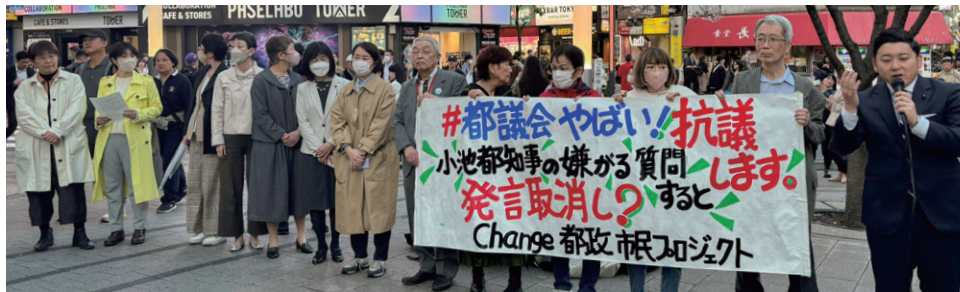
3/29@新宿駅東南口 市民団体による緊急抗議集会に複数の都議が参加し報告