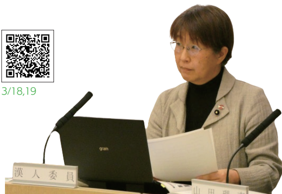
3/19@環境・建設委員会