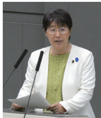
6/5 14人の一般質問の最後に登壇

一般質問とは 都政全般について知事に対して行う質問。都議会では会派によりますが概ね各議員年1回10数分。大会派は他に代表質問がありますが、ひとり会派はできません。