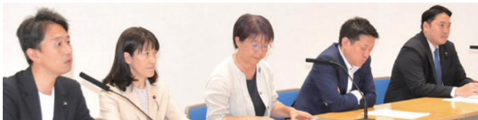
6/6@都庁記者クラブ 条例改正案について提案会派の代表で記者会見

条例改正案説明の記者会見では、漢人もかつて職業訓練校(当時)で学んだ経験から、無償化の必要性を訴えました。