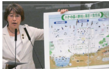
2022年6月「ハケの森と野川と草原の生態系図」(野川はたる村)を掲げ、事業化中止を求めて一般質問

ところが、都は再び「道路ありき」で「優先整備路線」とする【案】を出したのです。自然環境を守ろうとする小金井の民意は反映されていません。